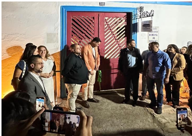
Momento de corte da fita de reinauguração do Museu