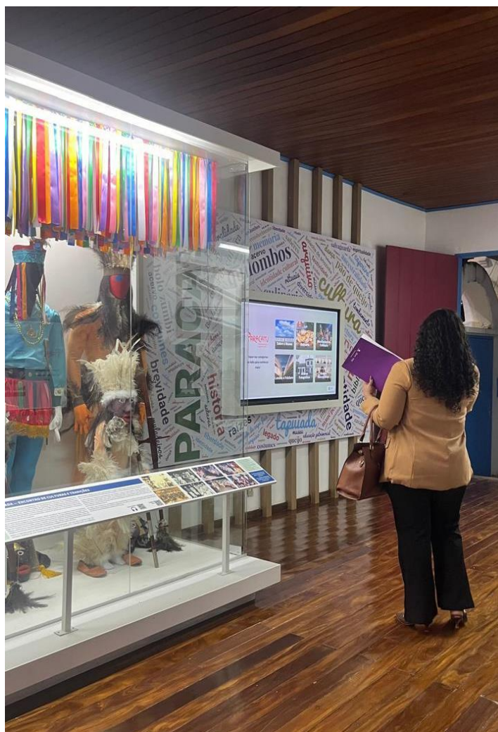
Visita a exposição antes da cerimônia de abertura Data: 06/11/2024

Inicialmente, a equipe do Semente foi convidada pelo museólogo Diego a visitar o Museu Histórico Municipal de Paracatu antes da cerimônia de reinauguração. Essa visita antecipada possibilitou à equipe vistoriar e fotografar a exposição sem a presença do público visitante.