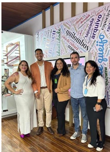
Equipe responsável pela reestruturação do Museu e da Plataforma Semente