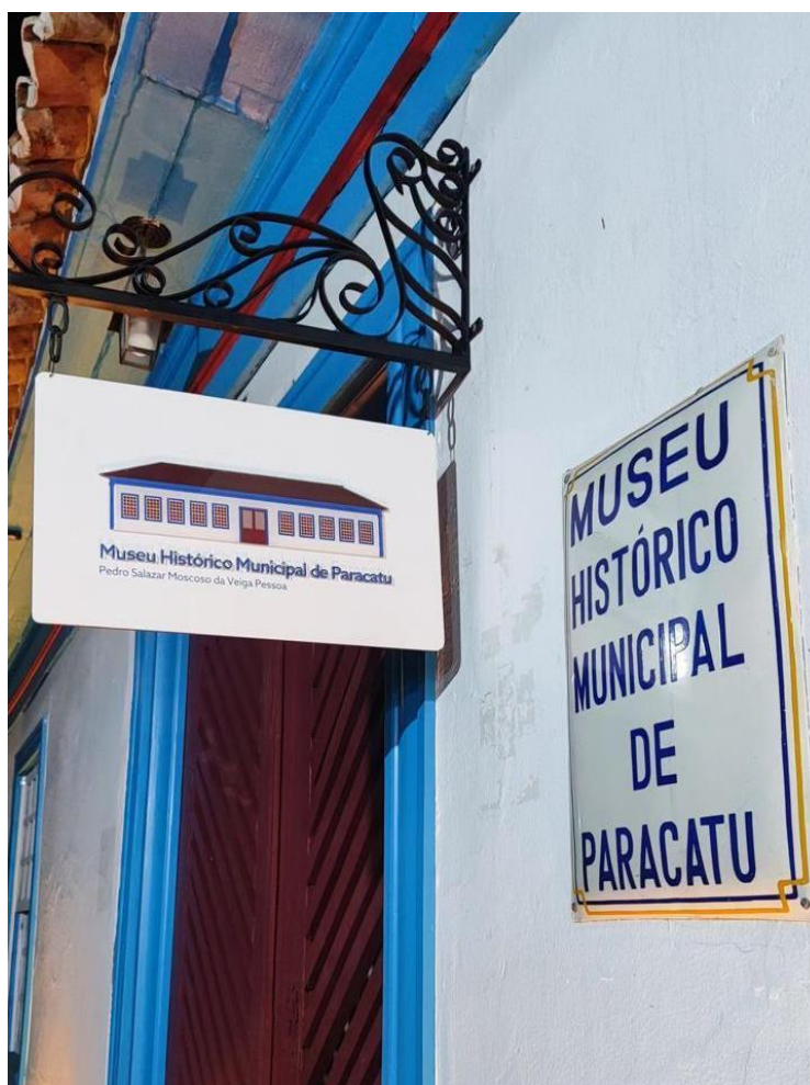
Fachada do Museu Histórico Municipal de Paracatu