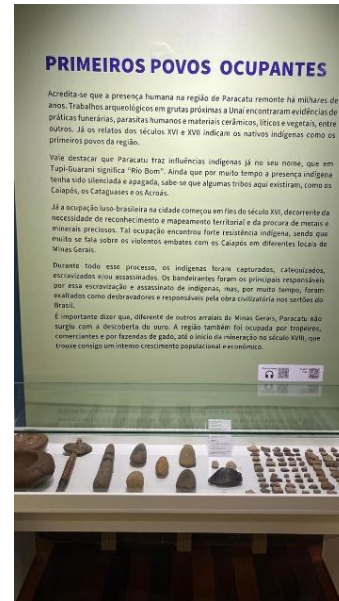
Vitrine de exposição com acervo da Caretagem Autoria: Natália Morita Data: 06/11/2024