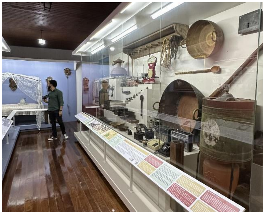
Vitrine de exposição com acervo sobre serviços Data: 06/11/2024