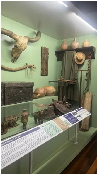
Vitrine de exposição com acervo dos tropeiros Data: 06/11/2024