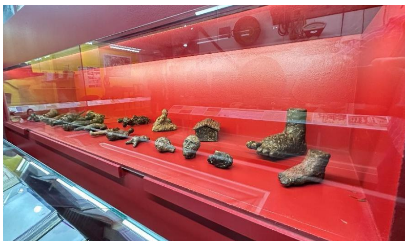
Vitrine mostrando esculturas de ex-votos Data: 06/11/2024

A exposição foi dividida por temas e cada qual recebeu uma cor de pintura da parede e mobiliário. A começar o roteiro da exposição, tem-se uma vitrine dedicada à história dos povos originários, aos tropeiros viajantes pelo interior do país, à mineração na região, uso de mão-de-obra escravizada, diferentes manifestações religiosas, mobiliário de casa típica e utensílios de serviços.