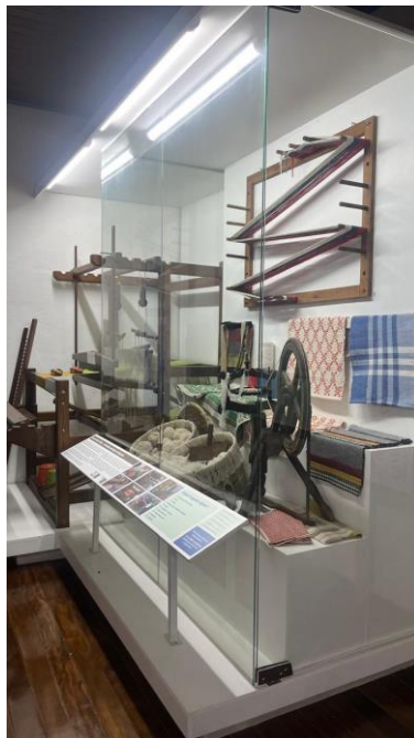
Vitrine de exposição sobre o ofício de tear Data: 06/11/2024