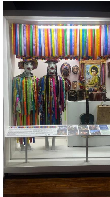
Painel e vitrine de exposição sobre os povos originários Autoria: Natália Morita Data: 06/11/2024