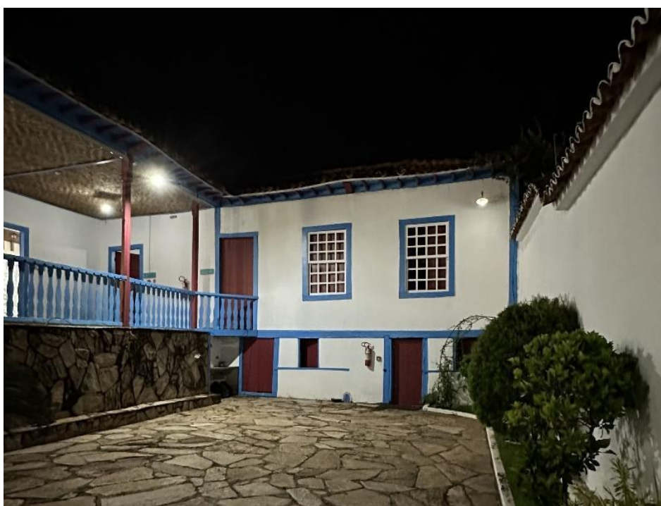
Vista posterior da edificação a partir do quintal

O prédio que abriga o Museu Histórico Municipal de Paracatu, foi restaurado e inaugurado em meados de 2022, não contemplando a reformulação museológica e conservação do acervo. A proposta entrou na Plataforma Semente através da Associação Amigos da Cultura de Paracatu, a fim de buscar recursos para melhoria na narrativa e valorização da história e cultura Paracatuenses, sendo este executado juntamente com a participação da comunidade.