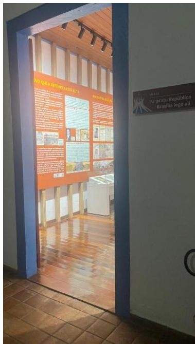
Entrada de uma sala de exposição a partir do corredor Data: 06/11/2024

A exposição foi dividida por temas e cada qual recebeu uma cor de pintura da parede e mobiliário. A começar o roteiro da exposição, tem-se uma vitrine dedicada à história dos povos originários, aos tropeiros viajantes pelo interior do país, à mineração na região, uso de mão-de-obra escravizada, diferentes manifestações religiosas, mobiliário de casa típica e utensílios de serviços.