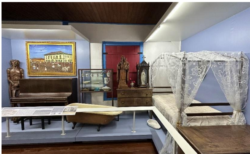
Vitrine simulando uma casa mineira Autoria: Francisco Luz Data: 06/11/2024